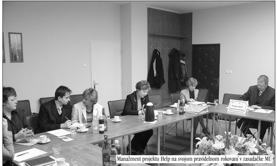
Manažment projektu Help na svojom pravidelnom rokovaní v zasadačke MÚ

V polovici mesiaca január zasadala Riadiaci výbor projektu. Členovia výboru prerokovali priebežnú Monitorovaciu správu mapujúcu aktivity v období september až december 2005, monitorovací report zostavený partnerskou organizáciou Euroformes Žilina, priebeh financovania projektu a predovšetkým bol ustanovený Organizačný výbor pre prípravu nadnárodného stretnutia partnerov projektu. Toto stretnutie by sa malo uskutočniť v dňoch 22. - 25. mája v Handlovej za účasti partnerov z Francúzska, Portugalska a Talianska. Súčasťou stretnutia budú odborné semináre a prezentačné podujatia. Okrem toho Organizačný tím pripravuje pre partnerov pestrý program zameraný na spoznávanie krás handlovského mikroregiónu, baníckej histórie, kultúry, prezentáciu nášho projektu ako i našich skúseností a možností v rámci realizácie jednotlivých aktivít. Význam stretnutia je neoceniteľný, keďže naši nadnárodní partneri vo svojich krajinách realizujú